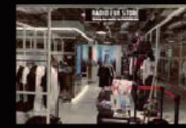
▲「EVANGELION Millennials 2」発売時(2020年9月)の店内の様子

RADIO EVA初の旗艦店として2019年11月22日のオープンから1年を迎えるRADIO EVA STORE。掲載商品の他に周年グッズも続々登場。