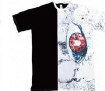
YOKO-004 Soul's REFRAIN

こちらも「新世紀エヴァンゲリオン」のオープニング場面写を中心に、モザイクアートによって初号機の横顔が浮かび上がるデザイン。 [SIZE] > L, XL, 2XL [PRICE] > 6,930円