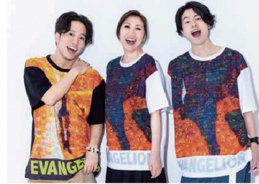
※ユニセックスタイプのオーバーサイズTシャツです。

「EVANGELION STORE」発のブランド「EVA BG(エヴァ・ピージー) ~BACKGROUND OF EVANGELION~」が、歌手・高橋洋子さんとコラボレーション。そのTシャツ4モデルを紹介します。